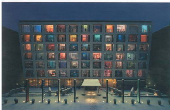
Saturday Night, 2007 © In Sook-Kim 83 x 121 cm C-Print, diasec, framed 9/20 First Print Price: 16,000 euros