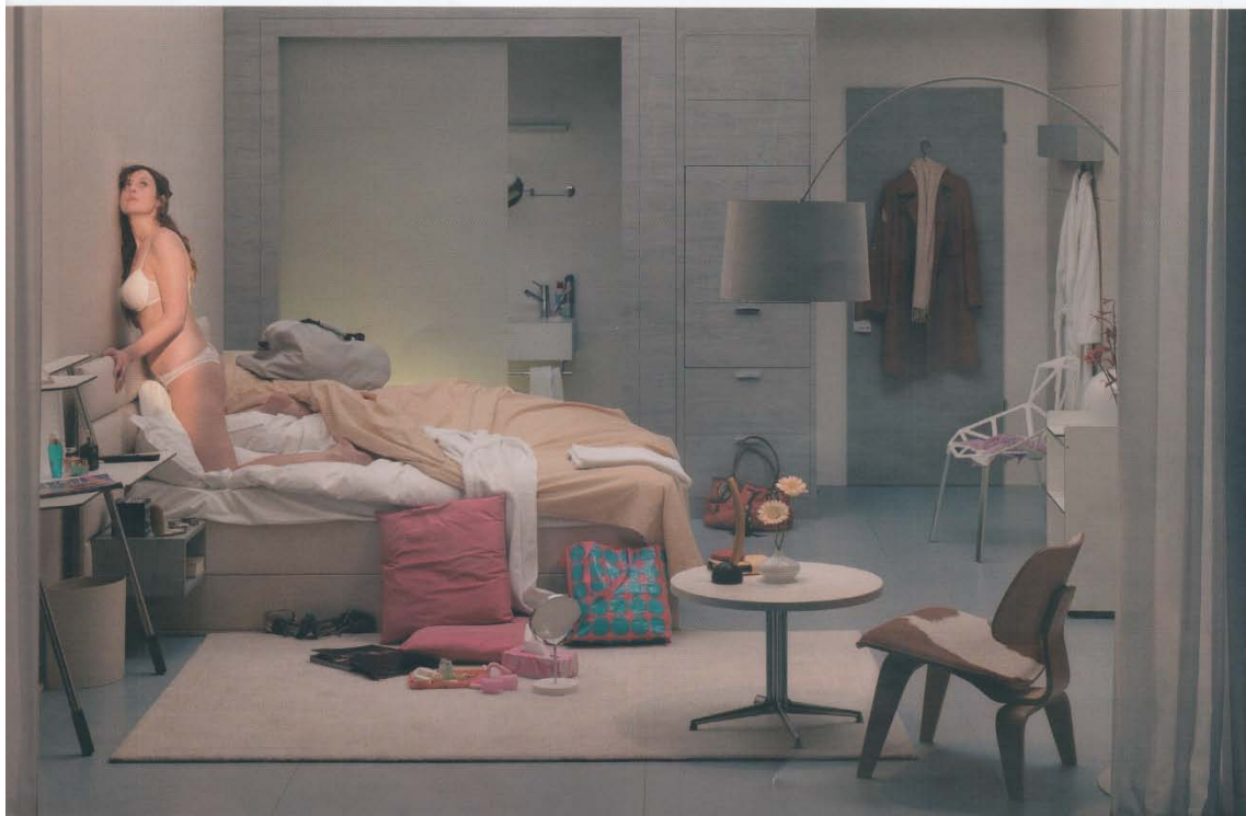
Room 108, 2007 © In Sook-Kim 140 x 100 cm C-Print, diasec, framed 3/5 Price: 9500 euros