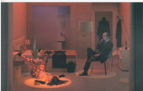
Room 204, 2007 © In Sook-Kim 140 x 100 cm C-Print, diasec, framed 3/5 Price: 9500 euros