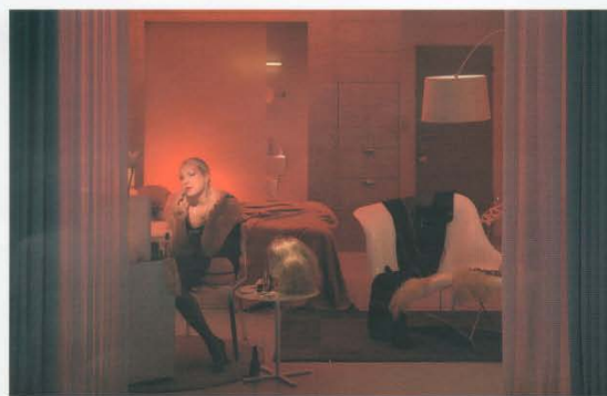
Room 409, 2007 © In Sook-Kim 140 x 100 cm C-Print, diasec, framed 3/5 Price: 9500 euros