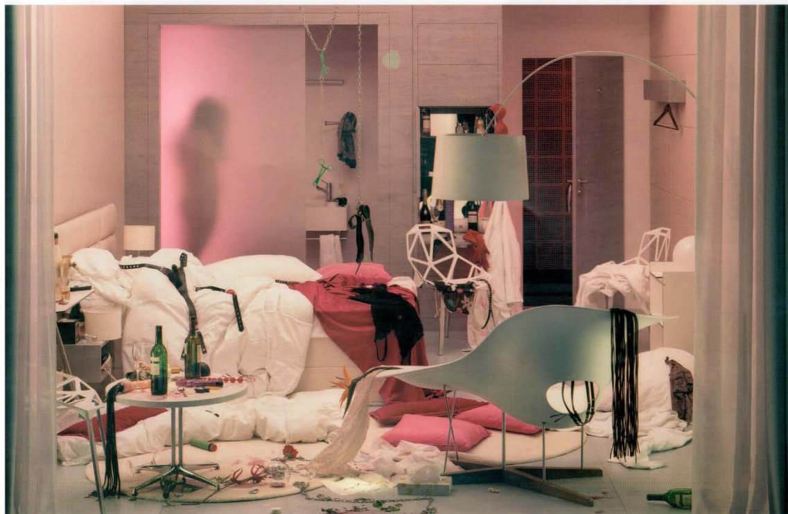
Room 104, 2007 © In Sook-Kim 140 x 100 cm C-Print, diasec, framed 3/5 Price: 9500 euros

In Kim Sook è un'artista visuale sudcoreana nata a Pusan nel 1969. Recentemente ha esposto a Parigi presso la galleria RX in una mostra dal titolo "Saturday Night", curata da Beatrice Ancillon ed incentrata sulle vicende occasionali degli ospiti dell'hotel Radisson SAS, nel quartiere Media Haven di Düsseldorf, dove la fotografa attualmente risiede. Il lavoro è molto originale: grazie alle luci delle camere che di sera man mano si accendono, possiamo spiare le persone che vi abitano come se ci trovassimo idealmente in un palazzo di fronte in veste di cecchini col mirino telescopico. C'è chi si stravacca davanti alla televisione, chi mangia in solitudine, chi fa sesso, chi girovaga seminudo. Dalla suora discinta e gghindata in maniera provocante al ciccone che divora un hamburger, fino al tipo dall'aria avvilita che si scola l'ennesima bottiglia. Taluni clienti guardano fuori dalla finestra diventando, a loro volta, osservatori osservati. Morale: siamo tutti dei voyeur. Le scene rettangolari che ritagliano le varie rooms 202, 308, 207 ricordano lo schermo piatto a cristalli liquidi. Le storie si aprono in media res e gli "attori" – fintamente ignari – ci rendono partecipi dei loro dispiaceri, delle loro inclinazioni, del loro isolamento, senza pudore.