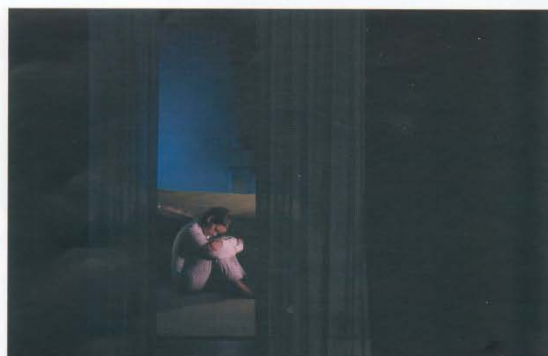
Room 103, 2007 © In Sook-Kim 140 x 100 cm C-Print, diasec, framed 3/5 Price: 9500 euros