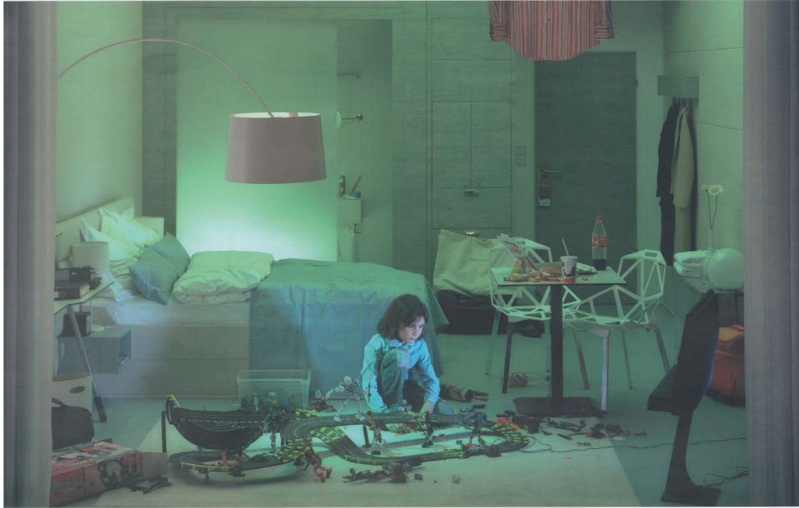
Room 308, 2007 © In Sook-Kim 140 x 100 cm C-Print, diasec, framed 4/5 Price: 9500 euros