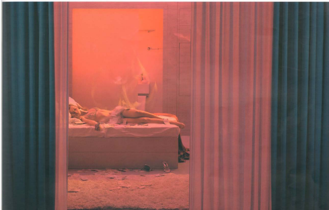
Room 506, 2007 © In Sook-Kim 140 x 100 cm C-Print, diasec, framed 4/5 Price: 9500 euros