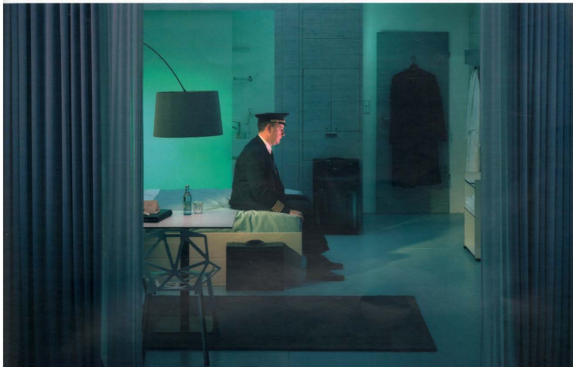
Room 509, 2007 © In Sook-Kim 40 x 100 cm C-Print, diasec, framed 1/5 Price: 9500 euros

All images © In Sook-Kim. Courtesy Galerie RX, Parigi